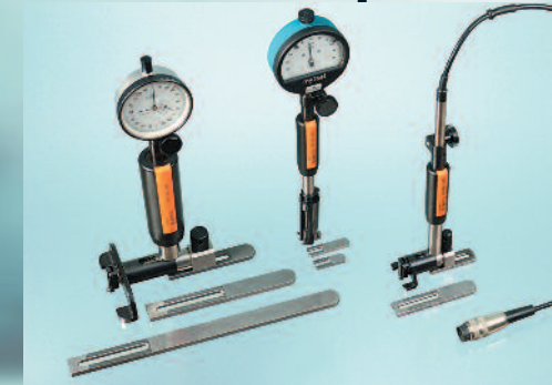
SUBITO® SS für Grundlochbohrungen

s: Messweg D: zu messender Durchmesser h: Stirnmaß