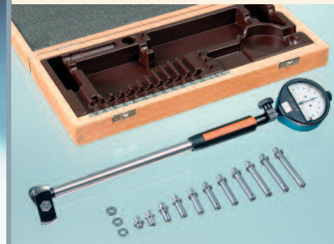
SUBITO® SU 50 - 100

Lieferumfang: wie Baureihe SU, jedoch Halter mit fest montiertem Winkelstück.