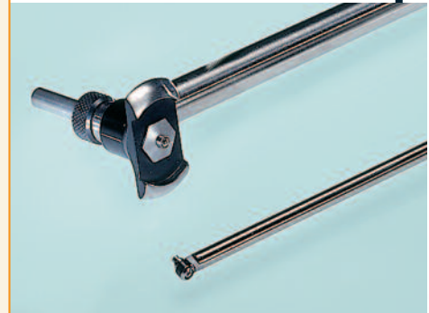
SUBITO® SU 4,5 - 6 und SU 35 - 60