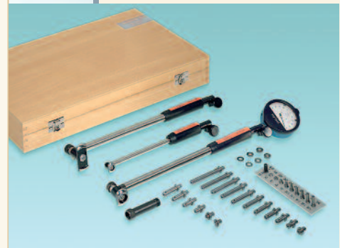
SUBITO® mehrere Komplettgeräte